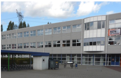
Graaf Engelbrecht College te Breda

Lokalen worden bekabeld met een twee aderige kabel in "ster" vorm. De overige luidsprekers worden bekabeld met een twee aderige kabel in een "bus" vorm.