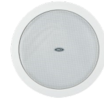
Plafond lokaalluidspreker, type T 105