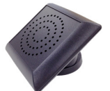
Luidspreker/microfoon type LS-EM-WOK (alleen simplex) Alleen luidspreker WOK Maten 110 x 110 mm.